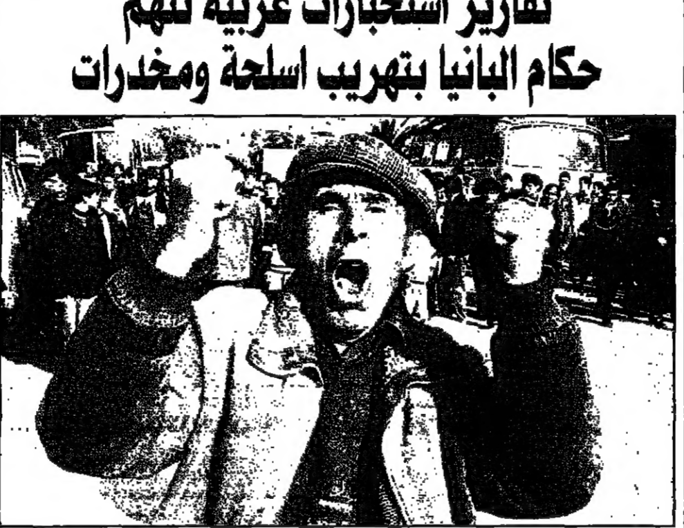
عجز البانيا يشارك في مظاهرات مناهضة لحكومة الرئيس صالح بريشا نشمت امس في مدينة ثوتوا (ريوتش)

■ لندن-جنرال-القدس العربي- وكالات- ذكرت صحيفة ذي نيوزتاند البريطانية امس الجمعة ان الحكومات الغربية تجاهلت تقارير اعطتها السلطات الاستخباراتية وجاهت تقارير كبير في الجريمة الاقتصادية ضد تايوان. وذكرت الصحيفة في صياغة مقالية عن أجهزة الاستخبارات في دول عدة قولها ان وثائق سرية في المستنقعات الأوربية تظهر خروجاً قديماً ونهجاً جديداً.